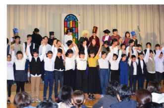
最高学年の劇はお見事