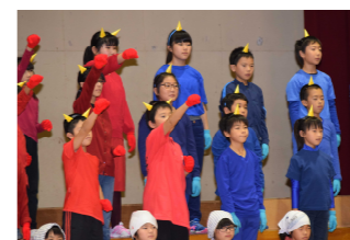
見ごたえのある音読劇