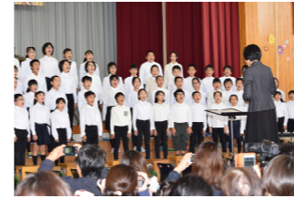
お見事な歌唱と演奏