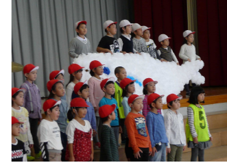
初めての学習発表会