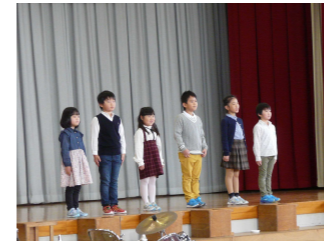
1年生はじめの言葉