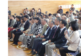
来賓の皆さんも大喜び