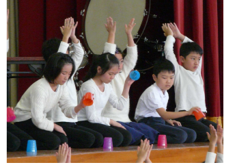
3年生リズム感抜群!