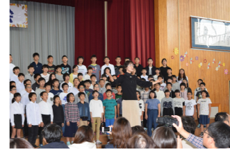
心を一つに全校合唱