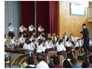
さすがの演奏吹奏楽部