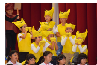
かわいらしい2年生